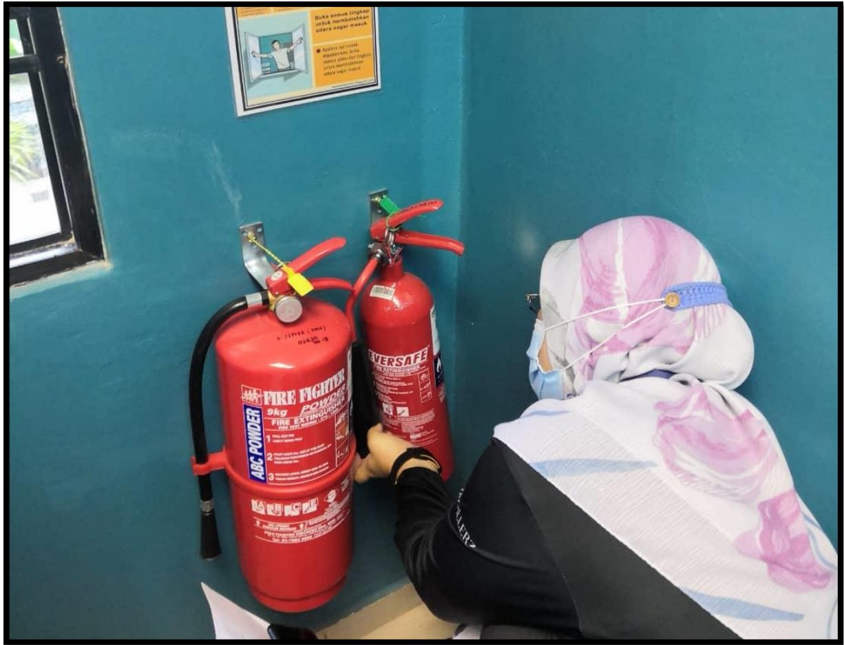
Pemeriksaan alat pemadam api