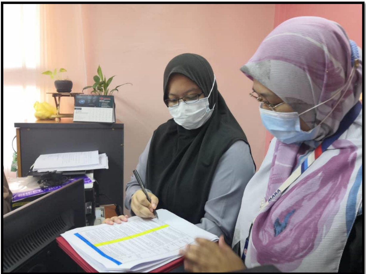
Penandaan kriteria pemarkahan

Proses audit Elemen 2 telah berjalan dengan lancar. Berikut adalah gambar-gambar semasa proses audit dijalankan.